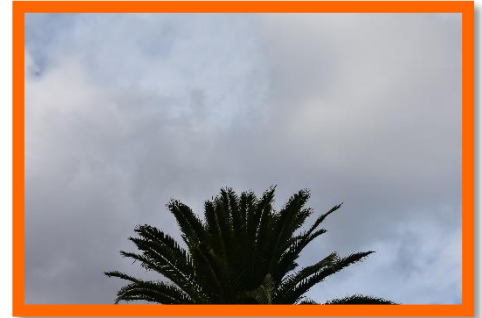
N°8 DANS LES AIRS OU SUR LA TERRE