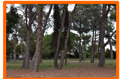
N°5 UN BRIN DE NATURE