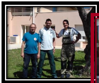
EHPAD Louis Fonoll

« Très bonne journée avec du personnel compétent et sympathique »