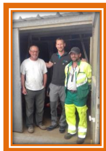
Association Thierry ALBOUY

« Super échange enrichissant des 2 côtés »